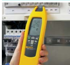
Posizione di fusibili e interruttori e assegnazione ai circuiti